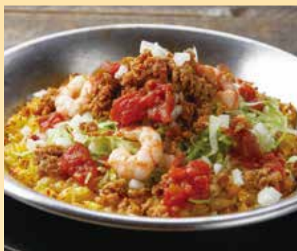
グリルドタコライス Grilled Tacorice