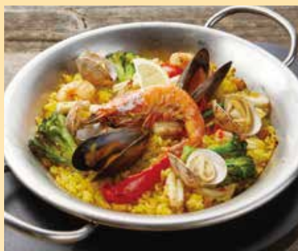
シェフズパエリア Chef's Paella