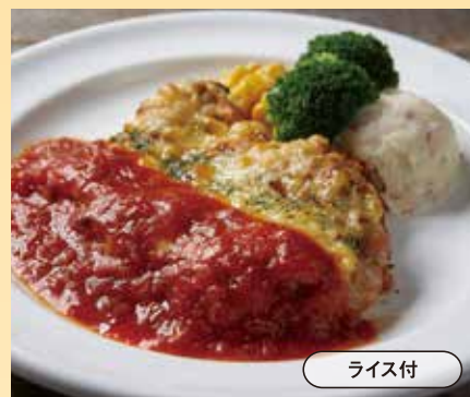
チキンミラネーズ Chicken Milanese